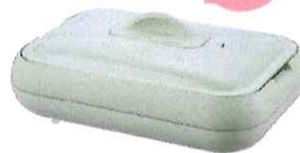
レコルト ホットプレート シングル グリーン