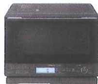
HITACHI スチームオープンレンジ ヘルシーシェフ