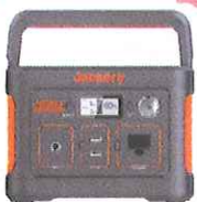
JACKRY ポータブル電源 [403Wh/4出力/AC・DC充電]