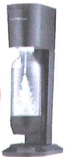
ソーダストリーム ジェネシス v3