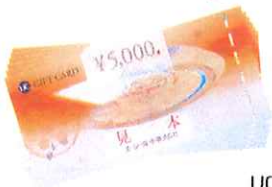
UC ギフトカード 3万円分